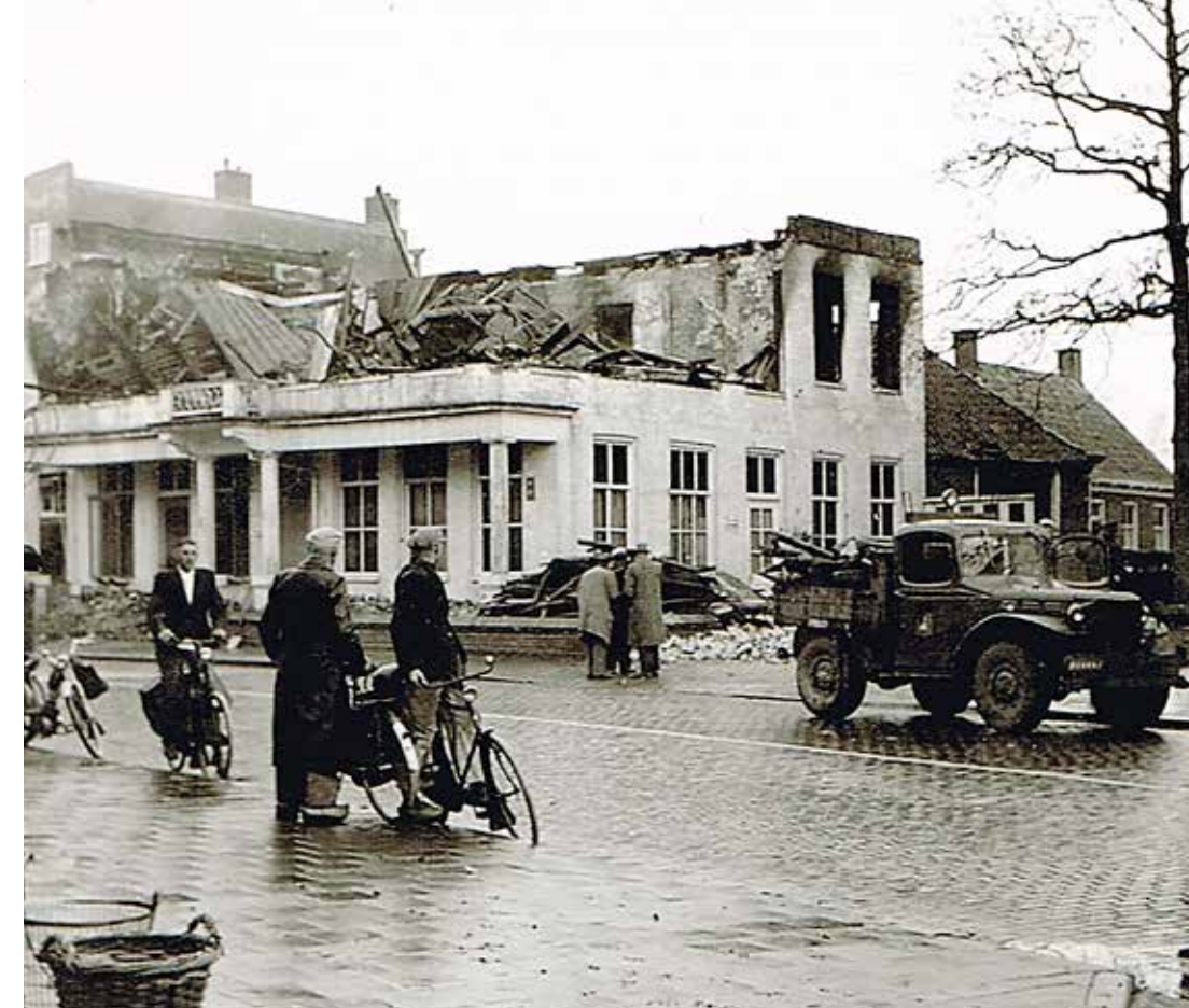
3D Hotel Van der Woude (voorheen Suurd), daags na de brand op de avond van 16 november 1956.