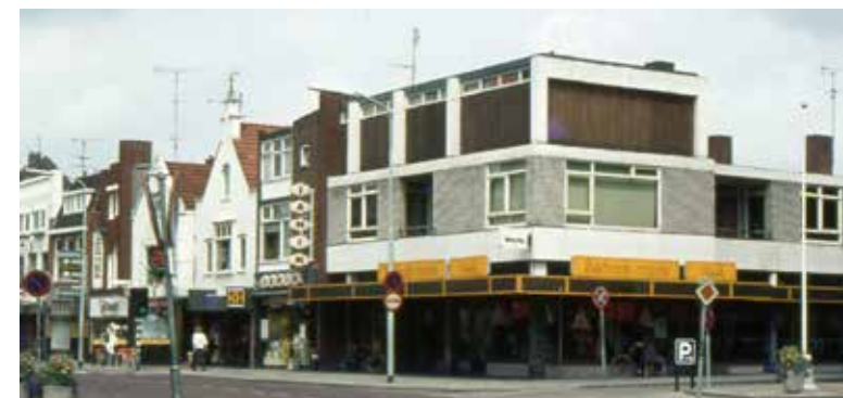
3E Herbouw als winkelpand (eerst Fa. Noorman, later Fa. Bertram).

Het pand wordt eigendom van een belegger die plannen ontwikkelt voor de bouw van