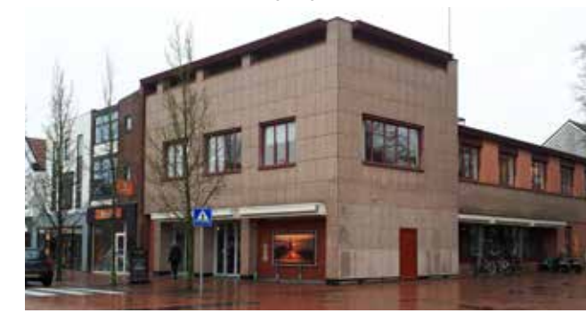
3F Winkelpand verbouwd tot bankgebouw, maar inmiddels niet meer als zodanig in gebruik.

Intussen wordt de puinhoop aan de Rijksstraatweg opgeruimd en daarna bouwt de fa. Noorman een nieuw winkelpand. In 1964 neemt de fa. Bertram deze winkel over. Dat duurt tot 1989. Bertram verhuist dan naar een andere plek aan de Rijksstraatweg en het winkelpand wordt verbouwd ten behoeve van de nieuwe fusiebank ABN-AMRO. Inmiddels is ook aan deze periode alweer een einde gekomen.