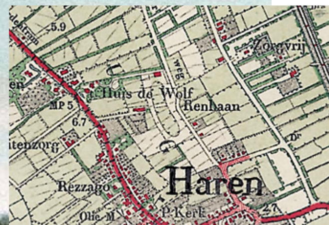
42E Op deze kaart van circa 1900 is de door Atze Wassenaar aangelegde renbaan nabij de Kerkklaan duidelijk te zien.

liet de oude bebouwing, die dicht bij de Rijksweg stond, afbreken en bouwde verder naar achteren op het perceel een geheel nieuw landhuis, het huidige 't Huis de Wolf. Wassenaar was een fervent paardenliefhebber. Achter zijn woning liet hij daarom een renbaan aanleggen en daarbij werd in 1906 ook een stalhouderij met twee dienstwoningen gebouwd aan de huidige Kerkklaan.