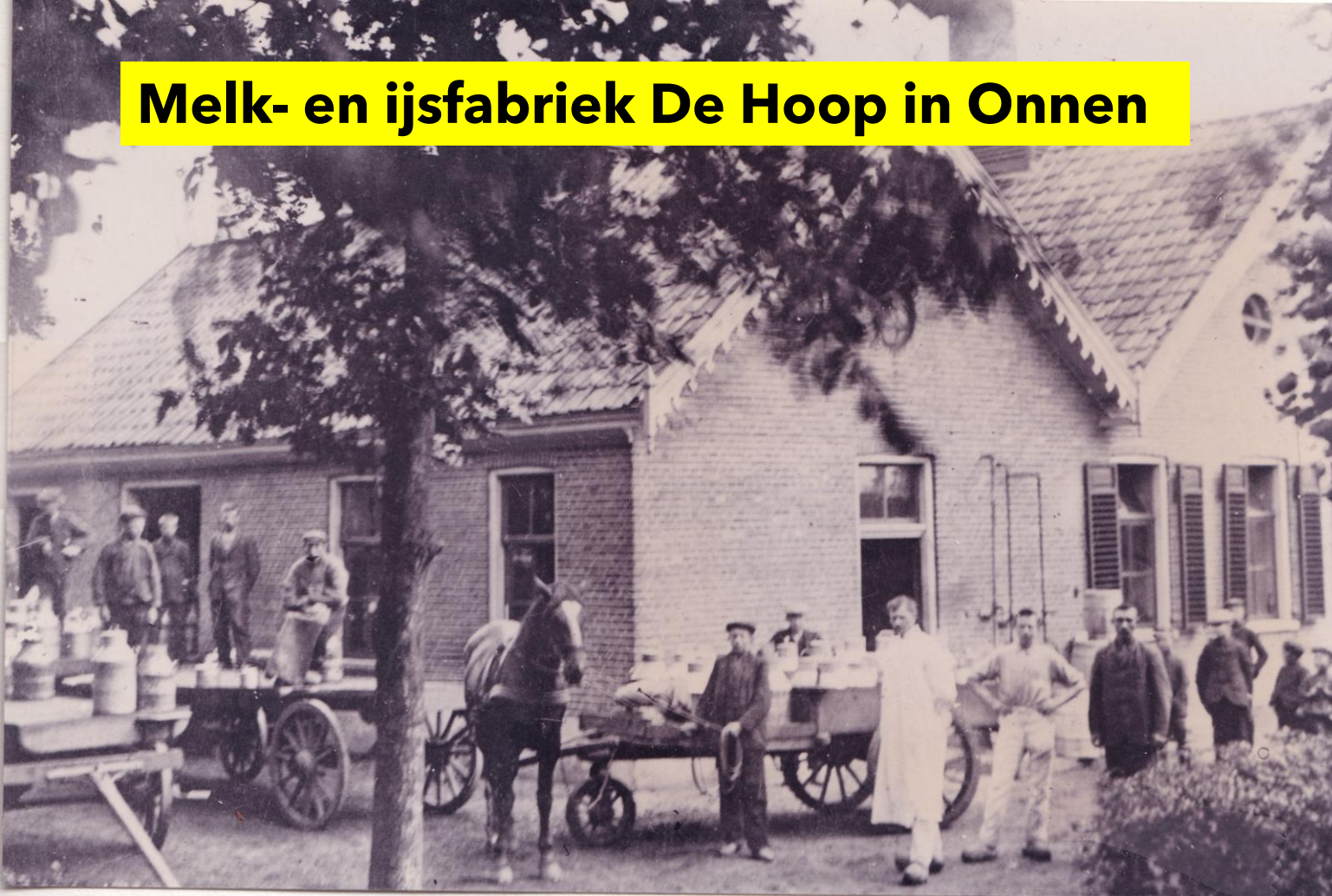
Melk- en ijsfabriek De Hoop in Onnen

Welk woord past het beste bij dit gebouw?